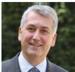
Pierre-Christophe Baguet Député-maire de Boulogne-Billancourt

À chaque période de vacances, nous vous proposons des séjours adaptés aux aspirations et à l'âge de vos enfants, à la montagne cet hiver au cœur des Alpes françaises, italiennes et suisses, puis dans nos belles régions du grand-ouest ou à l'étranger au printemps.